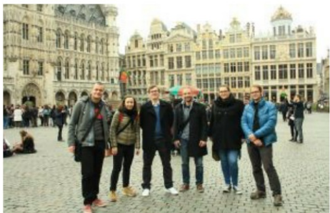
Nefiksovci v Belgiji na študijski izmenjavi.

Skupina za mednarodno sodelovanje za udeležence, ki se želijo mednarodno izobraževati, potovati, spoznavati različne države in kulture, iti na izmenjave ipd. Naše prostovoljce na omenjene aktivnosti pošljemo brezplačno.